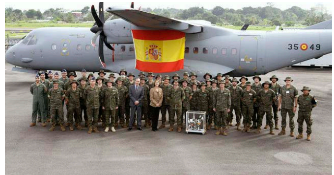
Encuentro de la anterior ministra de Defensa, María Dolores de Cospedal, con miembros de las Fuerzas Armadas desplegados en misiones internacionales durante su visita a la misión de Gabón.- 27 enero 2017.- @ EFE / Ministerio de Defensa

Las principales partidas exportadas por España con destino Gabón fueron: ali-