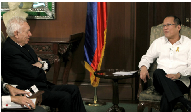
El anterior ministro de AA.EE y de Cooperación José Manuel García-Margallo, durante el encuentro con el entonces presidente de Filipinas, Benigno Aquino, celebrado en Manila en marzo de 2014.

que China causó graves daños a los arrecifes coralinos al construir estructuras artificiales en las Islas Spratly que son incompatibles con las obligaciones de un estado parte en la mencionada Convención sobre el Derecho del Mar.