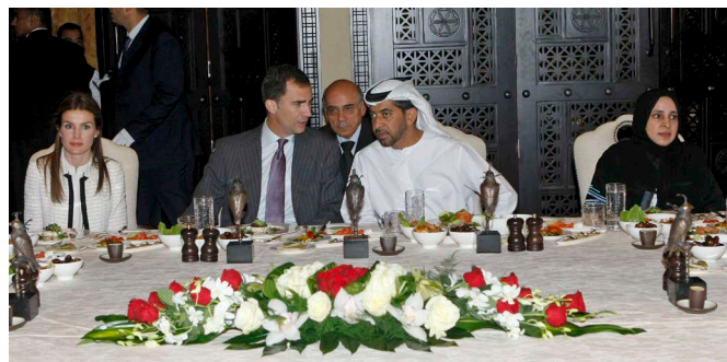
SS.AA.RR. los Príncipes de Asturias, junto al Jeque Hamdan Ben Zayed Al-Nahyane, vicepresidente del Consejo de Ministros de los Emiratos Árabes Unidos, y la embajadora de las Emiratos Árabes en España, Hissa Al Otaiba, durante su visita a Emiratos Árabes Unidos en enero de 2010.

Los intereses estratégicos españoles en EAU se han incrementado en los últimos años, tanto en el plano político, como en el económico, habiendo sido exponencial el crecimiento tanto del número de residentes españoles en los EAU como del número de empresas españolas instaladas en el país. Por parte emiratí existe, asimismo, un notable interés inversor en España que se plasma en la compra del 100% de la compañía española CEPSA por parte del Fondo soberano de Abu Dhabi, IPIIC. No obstante, a pesar del excelente estado de las relaciones bilaterales y de la enorme afinidad en el plano bilateral y multilateral, es de destacar el contencioso respecto de las energías renovables, surgido tras la revisión del marco regulatorio