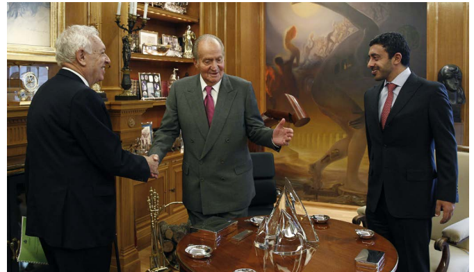
SM el rey Juan Carlos, junto al entonces ministro de Asuntos Exteriores y de Cooperación y su anterior homólogo emiratí, Abdullah bin Zayed Al Nahyan, durante la audiencia celebrada en el Palacio de La Zarzuela en febrero de 2014.

Cada uno de los siete Emiratos posee su propio gobierno local, cuya complejidad varía en función de su tamaño y población. Cada Emirato cuenta con un sistema