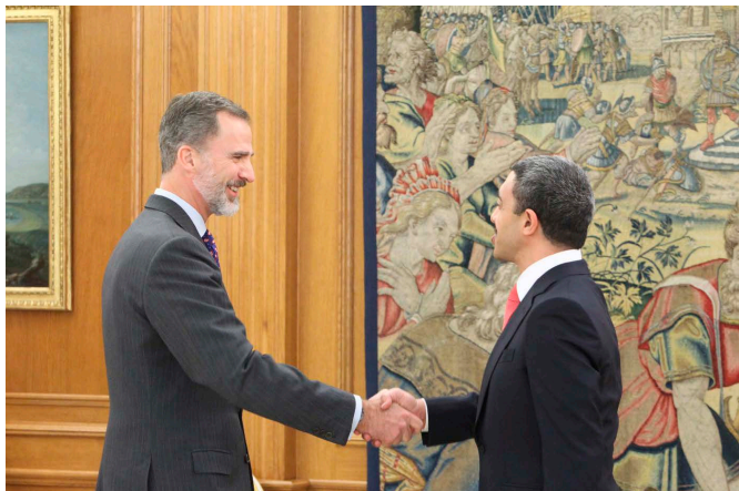
Su Majestad el Rey saluda a Su Alteza el Jeque Abdullah Bin Zayed Al Nahyan, ministro de Asuntos Exteriores y de Cooperación Internacional de los Emiratos Árabes Unidos.- Palacio de la Zarzuela, 29/01/2018.- © Casa de S.M. el Rey

La balanza comercial con EAU en la última década es claramente favorable a España. En 2016 las exportaciones españolas a EAU alcanzaron los 1.745 M€ mientras que nuestras importaciones procedentes de EAU fueron de 334 M€, lo que supone un superávit comercial para España de 1.412 M€. Tanto exportaciones como importaciones han disminuido respecto al año 2015 (exportaciones 1.813 M€; importaciones 458 M€). La mayor bajada en las importaciones ha hecho que la balanza comercial haya aumentado un 4% en favor de España.