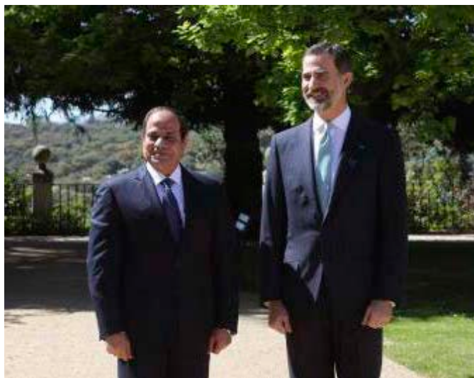
El rey Felipe VI y el presidente de Egipto, Abdel fatah al Sisi, durante su visita oficial a España, pasean por los jardines del Palacio de la Zarzuela, en abril de 2015.

21/26-10-2010 Diputado Jordi Xuclá. Reunión de la Asamblea Parlamentaria de la UPM.