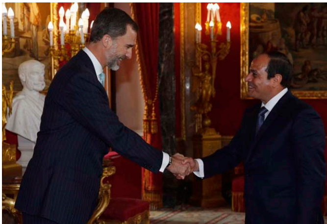
El rey Felipe VI y el presidente de Egipto, Abdel fatah al Sisi, durante su visita oficial a España, pasean por los jardines del Palacio de la Zarzuela, en abril de 2015.