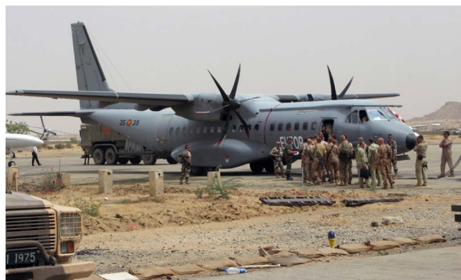
Un avión del Ejército del Aire español en Chad, durante su participación en la misión internacional EUFOR-Chad en 2008.

El Consejo Constitucional anunció el 3 de mayo de 2016 los resultados definitivos