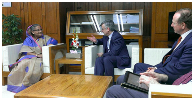
El anterior Secretario de Estado de Asuntos Exteriores, D. Ignacio Ybáñez Rubio, junto a la Primera Ministra de Bangladesh, Sheikh Hasina, durante su visita oficial a Bangladesh en marzo de 2015