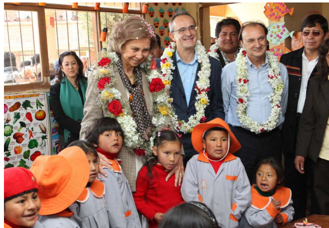
S.M. la reina doña Sofía, junto al embajador de España, Ángel Vázquez, y el secretario de Estado, Jesús Gracia, durante su visita la Unidad Educativa "España" en el marco de su viaje oficial a Bolivia en octubre de 2012.

Bolivia participa activamente en los procesos de integración regional america-