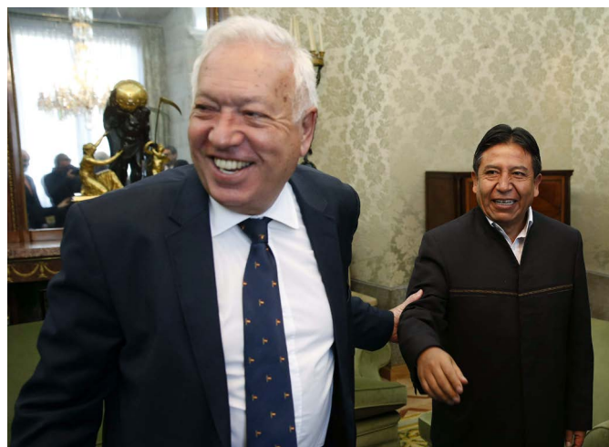
El anterior ministro de Asuntos Exteriores y de Cooperación junto a su homólogo boliviano, David Choquehuanca, durante su visita a Madrid en enero de 2015.

Las elecciones legislativas y presidenciales se celebraron el 12 de octubre de 2014, con victoria de Evo Morales y del Movimiento Al Socialismo (MAS) con el 61% de los votos.