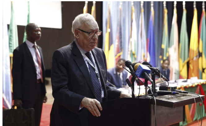
El anterior ministro español de Asuntos Exteriores, José Manuel García-Margallo, durante su intervención en Cotonou (Benín) en una conferencia ministerial organizada por la ONU.- Julio 2014.

La AOD bilateral neta acumulada destinada a Benín en el periodo 2007-2010 fue superior a 6 millones de euros donde destacan las contribuciones realizadas a través de la cooperación descentralizada, en especial de la Comunidad Valenciana,