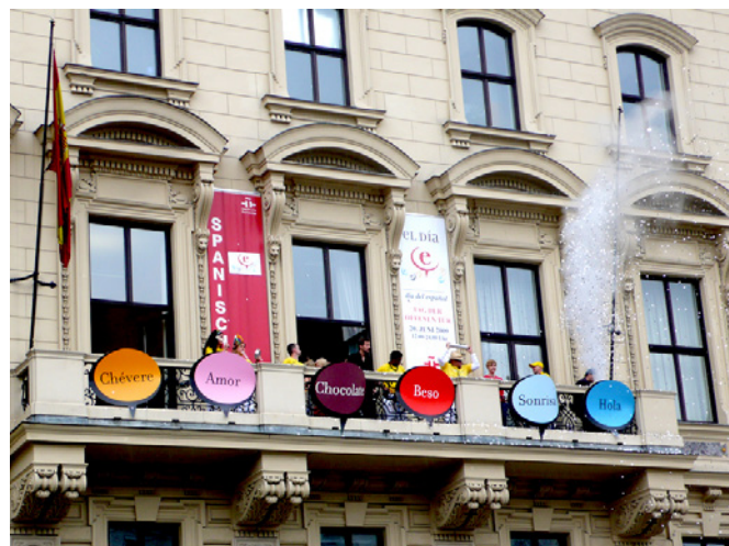
Fachada del Instituto Cervantes de Viena

Hay una importante cooperación cultural desarrollada por la embajada de Es-