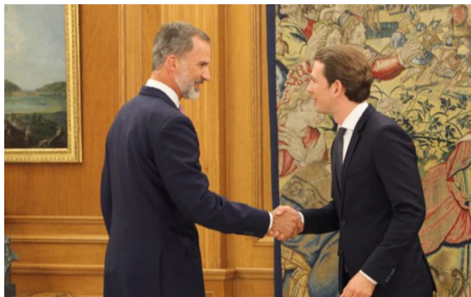
Su Majestad el Rey recibió en audiencia al canciller Federal de la República de Austria, Sr. Sebastian Kurz, con motivo de su visita a España.- Septiembre 2018.

marco de la Política Europea de Vecindad.