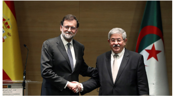
Encuentro del anterior presidente del Gobierno español D. Mariano Rajoy con su homólogo argelino, Ahmed Ouyahia, durante la reunión plenaria de la VII Cumbre Bilateral Argelia-España. Abril 2018.

Las relaciones de cooperación al desarrollo entre España y Argelia se articulan a partir del Convenio Básico de Cooperación Científica, Técnica, Cultural y Educativa de 1993.