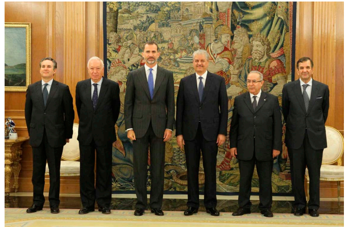
Audiencia de SM el Rey al anterior Primer Ministro Sellaal con ocasión de la celebración de la VI RAN en Madrid, el 21 de julio de 2015.

Por lo que respecta a Libia, su estabilización se ha convertido en una cuestión de seguridad nacional, por lo que promueve una solución política que preserve la unidad, la integridad territorial y la soberanía del país vecino así como la no injerencia de fuerzas extranjeras y un papel preponderante de los estados vecinos. La inestabilidad del país vecino le ha obligado a un importante despliegue de fuerzas militares en la frontera Este.