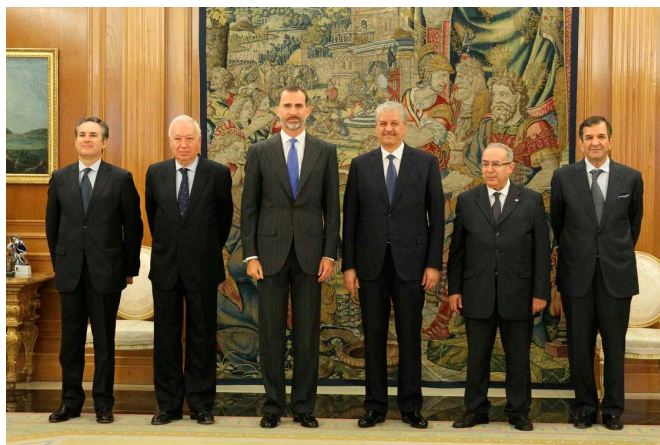
Audiencia de SM el Rey al anterior Primer Ministro Sellal con ocasión de la celebración de la VI RAN en Madrid, el 21 de julio de 2015.

En el caso de Túnez, el intercambio de los últimos tiempos de viajes y visitas oficiales muestra la voluntad de ambos países de reforzar las relaciones bilaterales, abordando aspectos fundamentales como la seguridad de las fronteras y la cooperación en materia de lucha contra el terrorismo, y especialmente impulsando iniciativas para la solución de la crisis libia. También destacan la cooperación en el terreno económico, con proyectos de interconexión eléctrica y gasística, infraestructuras y la reducción de barreras aduaneras.