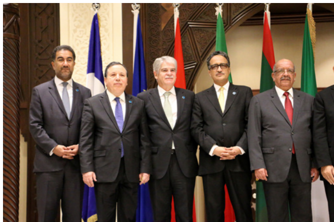
Reunión de los ministros de Asuntos Exteriores del grupo 5+5 para el Mediterráneo.- Argel, 21 de enero de 2018.