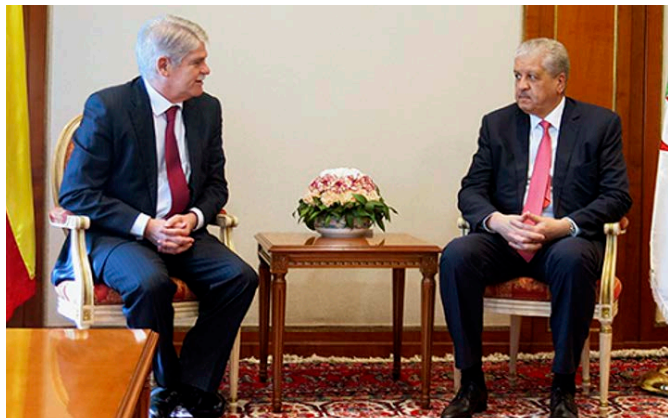
Encuentro de Alfonso Dastis junto al entonces primer ministro argelino, Abdelmalek Sellal, con motivo del viaje a Argelia. - marzo 2017.

En lo que a Organizaciones Económicas Regionales se refiere, Argelia es miembro del Banco Africano de Desarrollo (BAfD), del Banco Árabe para el Desarrollo Económico de África (BADESA), del Fondo Árabe para el Desarrollo Económico y Social (FADES), y del Banco Islámico de Desarrollo.