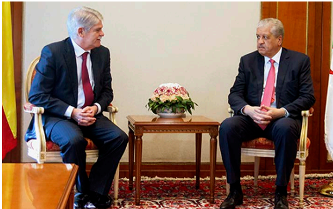
Encuentro de Alfonso Dastis junto al entonces primer ministro argelino, Abdelmalek Sellal, con motivo del viaje a Argelia. - marzo 2017.

Africano de Estudios e Investigación sobre Terrorismo (CAERT en sus siglas en francés), organismo dependiente de la Unión Africana focalizado en el estudio y el seguimiento de las cuestiones relativas al terrorismo en África. Por último, Argelia es miembro y principal impulsor del CEMOC (Comité de Estado Mayor Operacional Conjunto), foro de concertación de las Jefaturas de Estado Mayor en el ámbito del Sahel, con sede en la ciudad de Tamamrasset, en el que también son miembros Mauritania, Mali y Níger