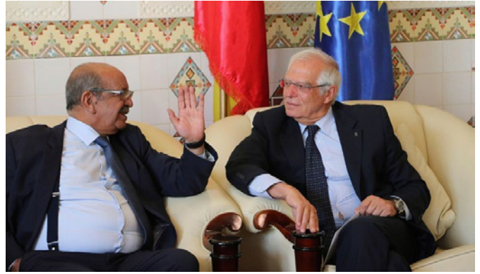
El ministro español de Asuntos Exteriores, Josep Borrell, durante la reunión con el anterior ministro de Exteriores argelino, Abdelkader Mesahel.- ARGEL (Argelia), 6/9/2018