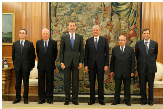
Audiencia de SM el Rey al anterior primer ministro Sellaal con ocasión de la celebración de la VI RAN en Madrid, el 21 de julio de 2015.

Diplomado por la Escuela Nacional de Administración (ENA), es diplomático de profesión, comenzando su carrera como secretario en prácticas en