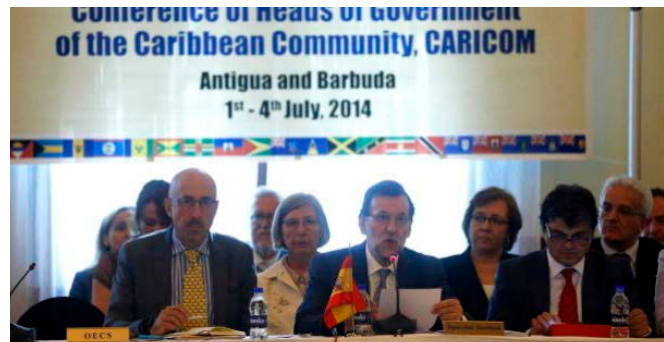
El Presidente de Gobierno, D. Mariano Rajoy, en la XXXV Cumbre de jefes de Estado y de Gobierno de la CARICOM, celebrada en Antigua y Barbuda, julio 2014

Las inversiones de Antigua y Barbuda en España son mínimas. Los últimos datos disponibles (2008: 1.524.180 euros, 2009: 259.920 euros y 2012: 54.690 euros)