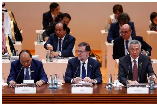
El presidente del Gobierno, Mariano Rajoy, durante la sesión plenaria de la cumbre de jefes de Estado y Gobierno del G20, en Hamburgo (Alemania) 07/07/2017

El Bundestag (Cámara baja) representa al pueblo alemán. Es elegido por el pueblo por un período de cuatro años (la última vez en septiembre de 2013). Las principales funciones del Bundestag son la elaboración de las leyes, la elección del Canciller Federal y el control del Gobierno. El sistema electoral seguido en los comicios al Bundestag alemán puede definirse como combinación del sistema mayoritario con el proporcional (sistema proporcional personalizado). Todo elector tiene dos votos. Con el primero vota de forma directa a un candidato de su circunscripción electoral, a cuyo efecto se aplica el sistema mayoritario relativo: el candidato que obtiene el mayor número de votos sale elegido. Con el