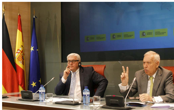
El ministro de Asuntos Exteriores y de Cooperación, José Manuel García-Margallo, junto a su homólogo alemán, Frank-Walter Steinmeier, en la rueda de prensa celebrada en el Palacio de Viana de Madrid en febrero de 2014.