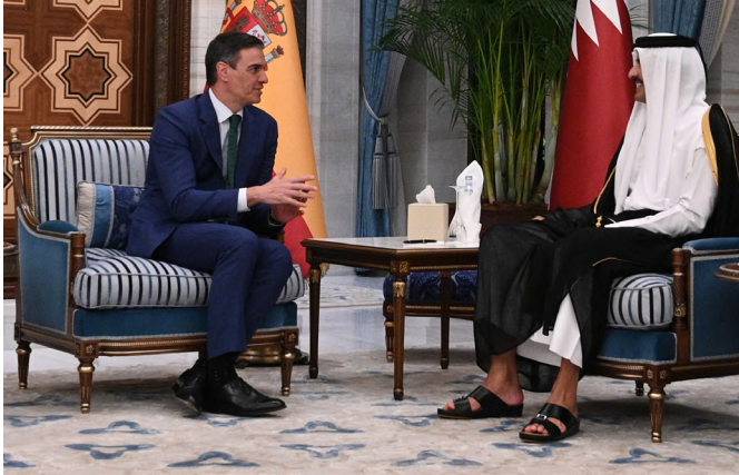
El presidente del Gobierno, Pedro Sánchez, en su encuentro con el emir de Catar, Tamim Bin Hamad Al Thani. Doha (Catar) 3.4.2024

en 2021 alcanzó los 8M € y en 2022 la cifra es de 4M €. En 2023 (datos hasta noviembre) los flujos de inversión fueron de 0M €. últimos años con una tendencia decreciente, siendo la cifra de 0 MEUR en 2020, 2021 y 2022. Los sectores en los que se ha centrado la inversión española de acuerdo con la información del Registro de Inversiones son los servicios a edificios, comercio mayorista, cinematografía, comercio al por mayor y servicios de información. La presencia de empresas españolas establecidas en Qatar ha ido creciendo en los últimos años destacando Iberdrola, FCC, Sacyr, Acciona Agua y Medio Ambiente, Aguas de Valencia, entre otras.