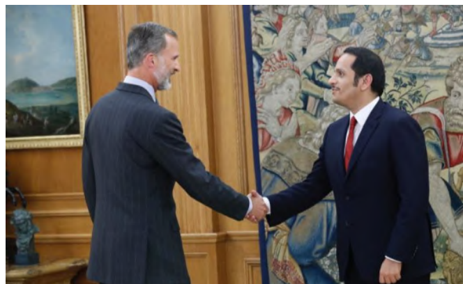
SM el Rey recibe el saludo del vice primer ministro y ministro de Asuntos Exteriores del Estado de Qatar, su excelencia el Jeque Mohammed Bin Abdulrahman Al-Thani.- Palacio de La Zarzuela, Madrid, 13.09.2018.

En el gobierno local, el Consejo Central Municipal, de 29 miembros, es elegido democráticamente desde 1999 (las últimas elecciones tuvieron lugar en 2019).