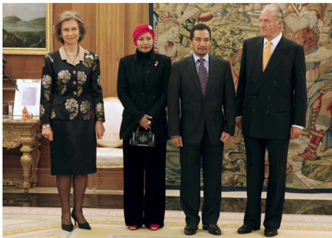
SS MM los reyes de España, junto a SS MM los reyes de Malasia, durante la visita oficial que realizaron a España, en octubre de 2008.

El Parlamento Federal es bicameral. La Cámara de Representantes (Dewan Rakyat), predominante, es elegida por sufragio universal cada cinco años. Cada uno de sus 222 miembros representa una circunscripción uninominal. La Cámara actual fue elegida en noviembre de 2022. El Senado o Cámara nacional (Dewan Negara) tiene 70 miembros, de los cuales 40 son elegidos por el Rey (a propuesta del Gobierno) y el resto por los Estados (dos por cada uno de ellos) y por los Territorios Federales.