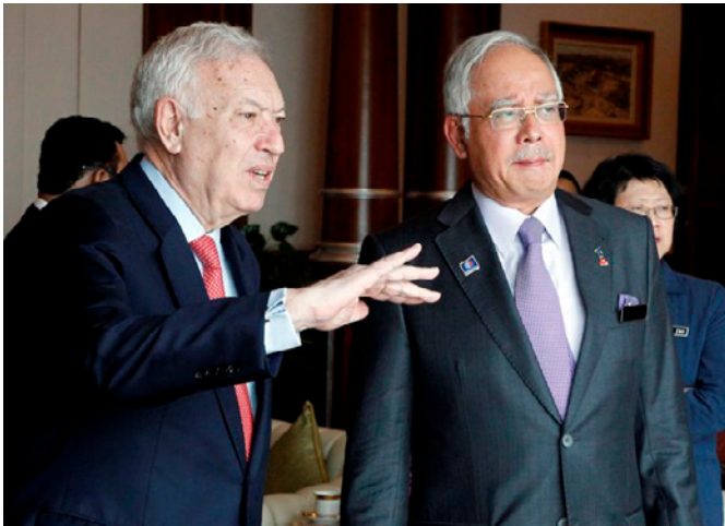
El anterior ministro de AA.EE y de Cooperación José Manuel García-Margallo, junto al entonces primer ministro de Malasia, Najib Razak, durante su visita a Kuala Lumpur en marzo de 2014.

alcanzó puntualmente un saldo positivo gracias a la exportación de aviones Airbus A400M a las fuerzas aéreas malasias, bienes con un alto valor unitario ensamblados en España.