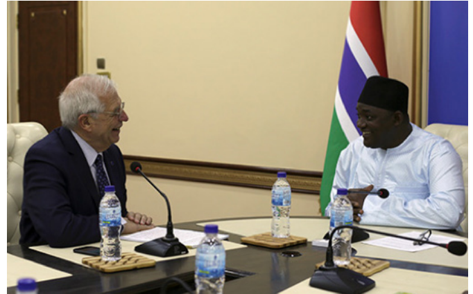
El entonces ministro Borrell fue recibido en Banjul por el presidente de Gambia, Adama Barrow.

tanto en la capacitación y donación de material, al Ministerio del Interior y la Armada gambiana. También se ha desplegado un apoyo operativo de Interior y se ha lanzado un Equipo Conjunto de Investigación contra la trata de seres humanos y el tráfico de personas.