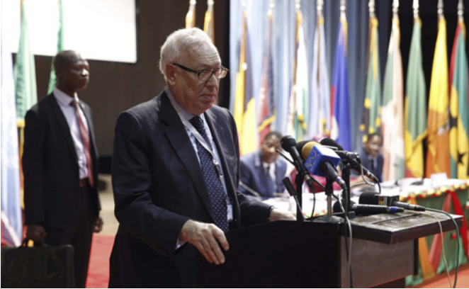
El anterior ministro español de Asuntos Exteriores, José Manuel García-Margallo, durante su intervención en Cotonou (Benín) en una conferencia ministerial organizada por la ONU.- Julio 2014.

Las importaciones de productos de Benín alcanzaron los 9 millones de euros en 2011, pero posteriormente se desplomaron: y no volvieron a alcanzar la cifra de 5 millones hasta 2016. Las importaciones casi se podrían calificar de testimoniales. Han rondado los 500.000 € en los tres últimos años. Se encuentran menos diversificadas destacando en el año 2022 los capítulos de: legumbres, hortalizas sin conservar (49%); cobre y sus manufacturas (23%). Para España, Benín es el 172º proveedor (2021), mientras que España es el cliente número 123 de Benín (2021, último dato disponible). El número de empresas regulares importadoras fue 2.