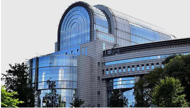
Edificio Parlamento Europeo (Bruselas)

Subdirección Gral de Asuntos Sociales, Educativos, Culturales y de Sanidad y Consumo