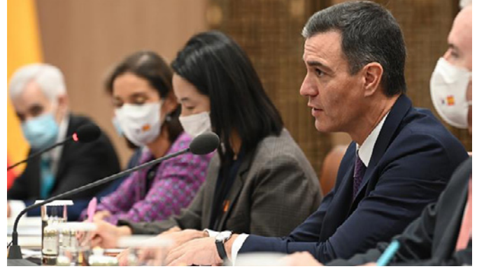
El presidente del Gobierno, Pedro Sánchez, interviene en el Foro Empresarial España-Corea. 18.11.2022.

Noviembre de 2022: Presidente del Gobierno, Pedro Sánchez, y la ministra de Industria, Comercio y Turismo, Reyes Maroto.