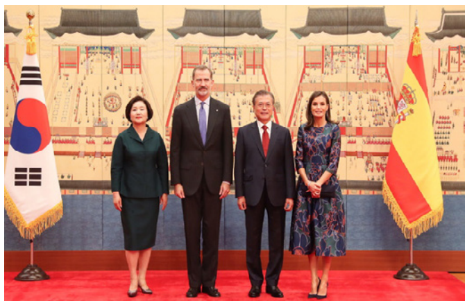
Sus Majestades los Reyes junto al presidente de Corea, Moon Jae-in y la primera dama de la República de Corea, Kim Jung-sook, tras el recibimiento oficial.- Seúl (República de Corea), octubre .2019.- © Casa de S.M.

reconducir la relación bilateral, lo que ha conseguido tras el intercambio de visitas con el primer ministro japonés, en marzo y mayo de este año. El anuncio por este gobierno de un mecanismo de compensación a las víctimas de trabajo forzado durante la ocupación japonesa a través de una fundación parece que ha conseguido resolver este contencioso entre ambos países.