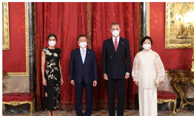
Sus Majestades los Reyes y sus Excelencias Moon Jae-in, Presidente de la República de Corea y señora Kim Jung-sook.- Palacio Real de Madrid, 16.06.2021.

El Partido Demócrata mantiene la mayoría absoluta en la Asamblea Nacional (169 escaños de 300) desde las elecciones de 2020. Las próximas elecciones legislativas están previstas para abril de 2024.