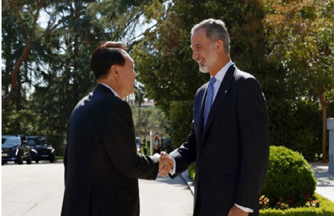
Su Majestad el Rey, junto a Su Excelencia el Sr. Yoon Suk Yeol, presidente de la República de Corea.-Madrid, 29/06/2022 (Palacio de la Zarzuela).-foto: © Casa de S.M. el Rey

16-11-2022.- Entrada en vigor del Acuerdo sobre cooperación en el ámbito de la salud pública para la prevención y respuesta a las enfermedades.