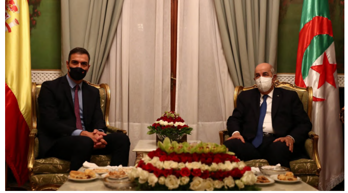
El presidente de Argelia, Abdelmajid Tebboune y el presidente de España, Pedro Sánchez, (octubre 2020).