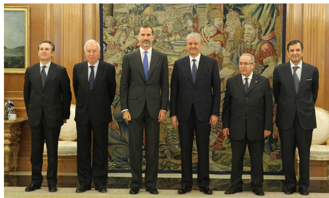
Audiencia de SM el Rey al anterior primer ministro Sellal con ocasión de la celebración de la VI RAN en Madrid, el 21 de julio de 2015.

Como diplomático ha desempeñado puestos destacados como Representante Permanente de Argelia en Naciones Unidas (2021-2023), Embajador en Egipto (2021-2019) y en Pakistán (2019-2020). En el MAE ha sido con-