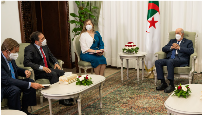
El ministro de Exteriores, José Manuel Albares, reunido con el presidente de Argelia, Abdelmadjid Tebboune. 30 de septiembre de 2021