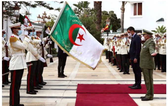
Viaje del presidente del gobierno Pedro Sánchez a Argelia.(Octubre 2020)